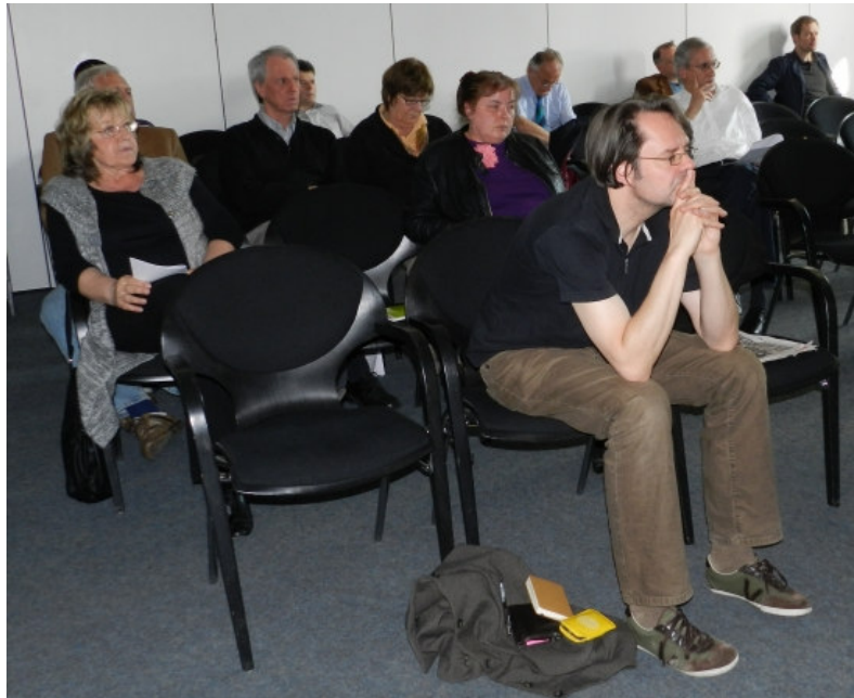
Die Zuhörschaft