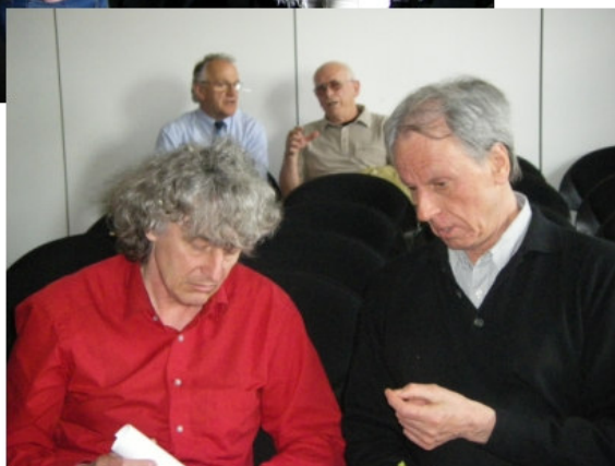
Gespräche nach der Veranstaltung