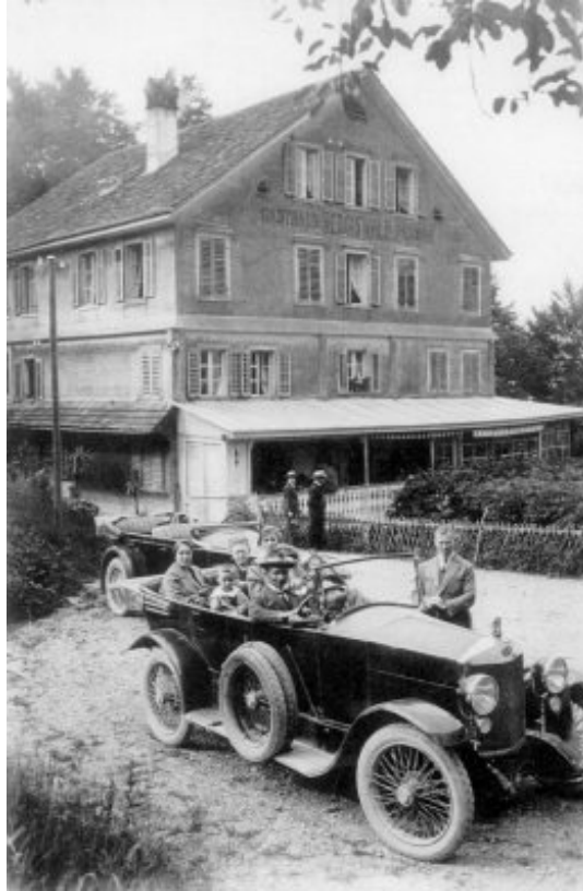
Urlaub in der Schweiz, 1925