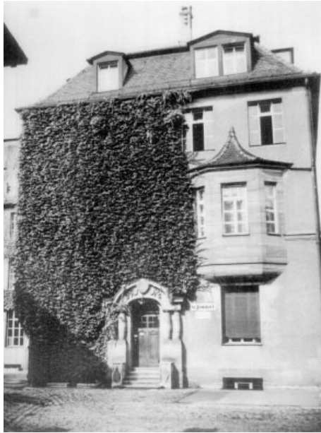
Das Fabrikantwesen G. Jondorf, errichtet 1913 (Aufnahme ca. 1937)

stellung von elektrischen Steckern und Steckdosen aus, die aus derselben Specksteinmasse wie die Brenner hergestellt wurden. Zum Vertrieb dieser neuen Produkte wurde eine Schwesterfirma, Elektronoris , gegründet.