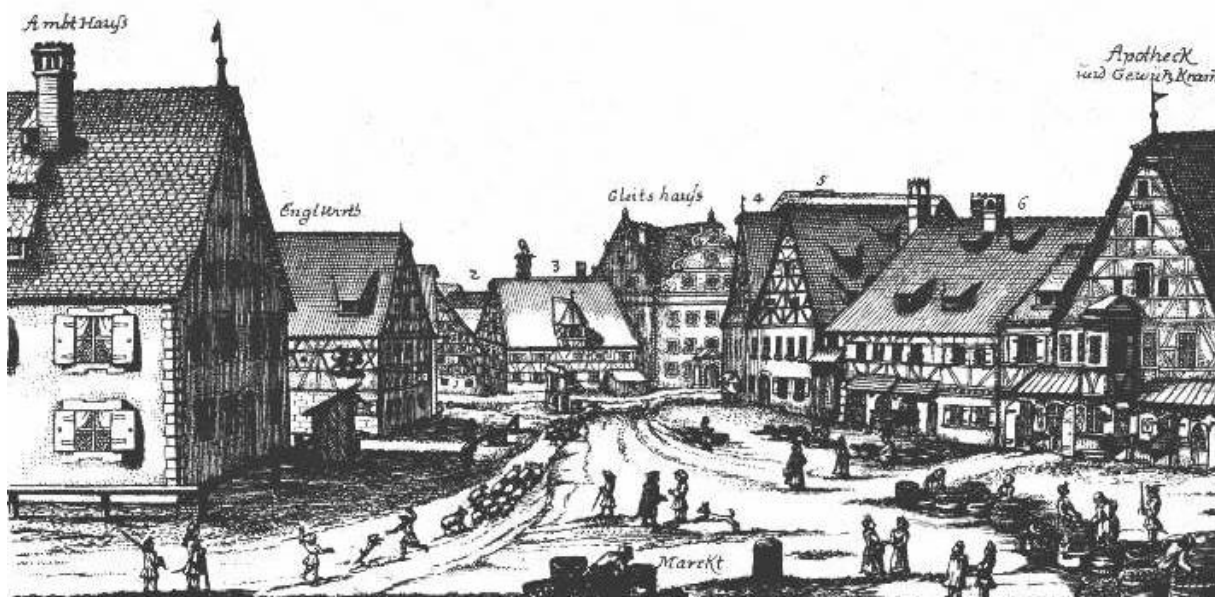
Der Fürther Marktplatz im Jahre 1705. Die Nr. 4 weist auf das Haus des "Juden Berman" hin.