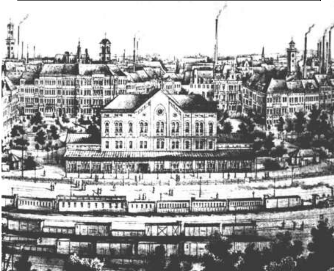
Die Industriestadt Fürth am Ende des 19. Jahrhunderts, oder, wie Jakob Wassermann sie nannte, "die Stadt der tausend Schloten."