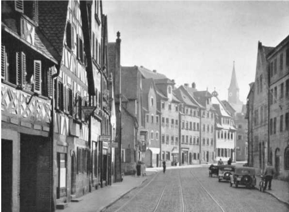
Alt-Fürth: Die Untere Königstraße vor dem Zweiten Weltkrieg