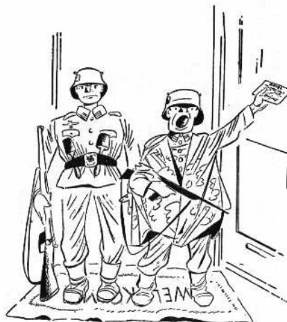
11. November, 7 Uhr morgens: Post für den Herrn