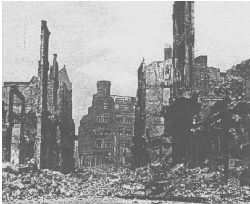
Nach dem Angriff vom 14.05.1940: Rotterdam, Korte Hoogstraat

Bis zum Jahr 1944 erleidet die Bevölkerung der in ihrem Kern vernichteten Stadt das gleiche Schicksal wie der Rest des besetzten Landes: Die Deutschen suchen sich Handlanger, die sie in den niederländischen Nazis der NSB (Nationaal-Socialistische Beweging) finden, mit deren Hilfe sie ein System aus Bespitzelung und Terror aufbauen. Die männliche Bevölkerung zwischen 18 und 35 Jahren wird zum Einsatz in der Rüstungsindustrie verpflichtet, viele davon in Betriebe im Deutschen Reich. Im Untergrund opponiert „Het verzet“ (der Widerstand) gegen Besatzer und Kollaborateure, doch auch er kann nicht verhindern, dass insgesamt 106.000 Juden aus den Niederlanden deportiert und ermordet werden, die Bekannteste von ihnen das Mädchen Anne Frank.