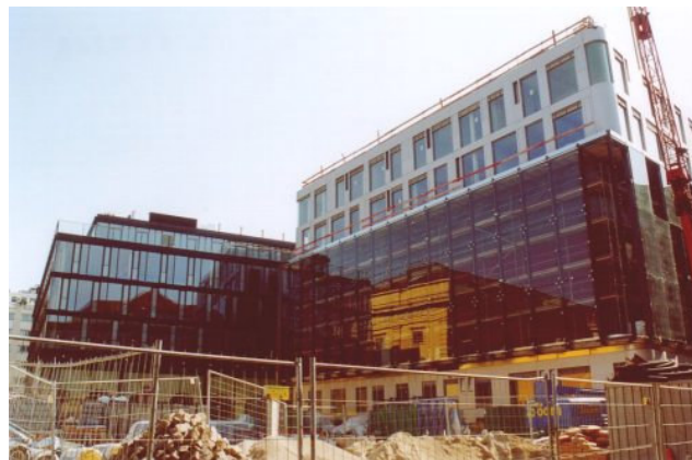
Kurz vor der Fertigstellung im September 2003: Links der kommerziell genutzte Neubau, rechts das Probengebäude, als Spiegelung präsent Klenzes Marstall

Weshalb wurde man bei den Besuchen der Baustelle den Eindruck nicht los, dass es sich hier nicht so sehr um ein sensibles städtebauliches Operations-, sondern ein Schlachtfeld zwischen Neu und Alt - letzteres deutlich in der Defensive -, Kommerz und Ästhetik, blinderischem Anspruch und dahinter liegender trister Betonwirklichkeit handelte? Wo war die zündende Idee einer spannungsreichen Verbindung von vorhandener und neuer Bebauung?