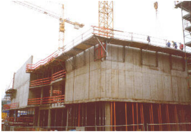
... und dahinter das künftige Probengebäude der Staatsoper