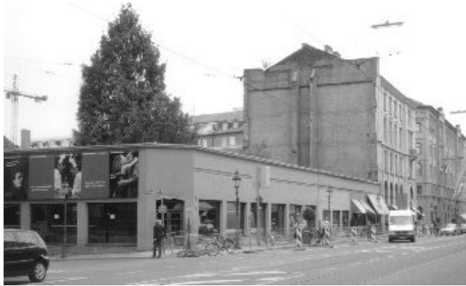
Das langlebige Provisorium: Der Flachbau des Kartenvorverkaufs vor dem Abriss, dahinter das Anwesen Maximilianstraße 15