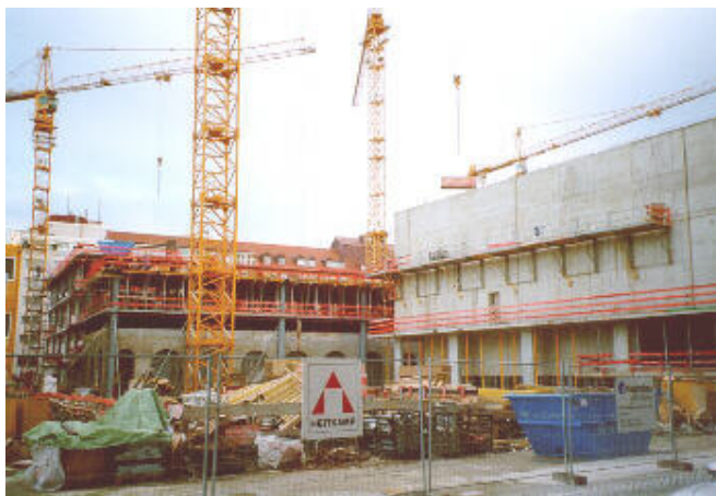
Dezember 2002: Hinter dem Probengebäude ist die Säulenhalle der Hofstallungen bereits in den Neubau integriert und harrt ihrer (unweigerlichen) gastronomischen Nutzung

Als architektonischer Schwachpunkt des Ensembles zeichnete sich schon im Rohbau das Probengebäude ab. Es mag zwar den technischen Nutzungsanforderungen optimal entsprechen und unter logistischen Aspekten kommod gelegen sein, trägt aber mit seinem Charme eines Parkhauses der 1970er Jahre nicht zur Aufwertung des Einmündungsbereichs Marstallplatz / Maximilianstraße bei. Ab hier wirkt der Platz zu einem Anlieferungsbereich verengt, der nichts mehr von den dahinter liegenden architektonischen Reizen ahnen lässt. Fast schon wehmütig erinnert man sich an die zwar nicht städtebaulich wertvolle, jedoch wesentlich lockerere Nachkriegsbebauung.