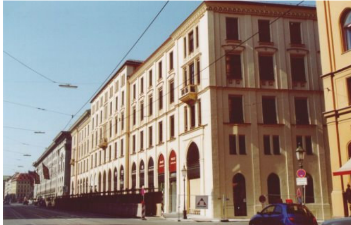
Die Schauseite: Bürkleinfassade an der Maximilianstraße

de, der „besten Immobilie am besten Standort“ und dass der „[Marstall-]Platz [...] erst durch die Neubauten seine besondere Wirkung“ entfalten werde.