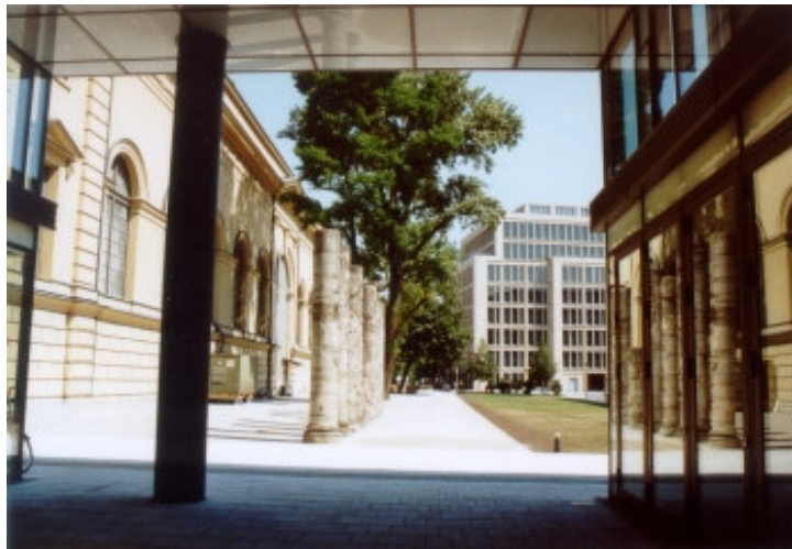
Und noch `n Hof und noch `ne Spiegelung ...

Als ein halbes Jahr nach der Eröffnung der Maximilianhöfe erst 25 Prozent der Gewerbeflächen vermietet waren, wurden aufkommende Gerüchte über einen Verkauf noch dementiert. Im Februar 2007 war aber die Zeit reif, um die Gewinne auf dem zumal in München noch immer hochtourig laufenden Immobilienmarkt zu realisieren: Der in London ansässige Immobilienfonds Doughty Hanson & Co. erhielt vom irischen Finanzunternehmen Quinlan Private 270 Mio. Euro für die Maximilianhöfe, angesichts von Investitionen in Höhe von 130 Mio. Euro auch unter Berücksichtigung von Steuern und Schuldzinsen eine hübsche Spanne in einer Zeit von gerade einmal drei Jahren. Noch atemberaubender wird das Geschäft, wenn man das Verhältnis von tatsächlich investiertem Eigenkapital des Fonds und Kapitalrückfluss aus Vermietung und Verkauf betrachtet: Letzterer war 5,7 mal höher als die Investitionssumme. Glücklich (und reich), wer bei diesem Spiel mit vielen Nullen mitspielen kann. Und ein zahnloser Wadlbeißer, wer an Architektur und Ästhetik der Maximilianhöfe herummäkelt.