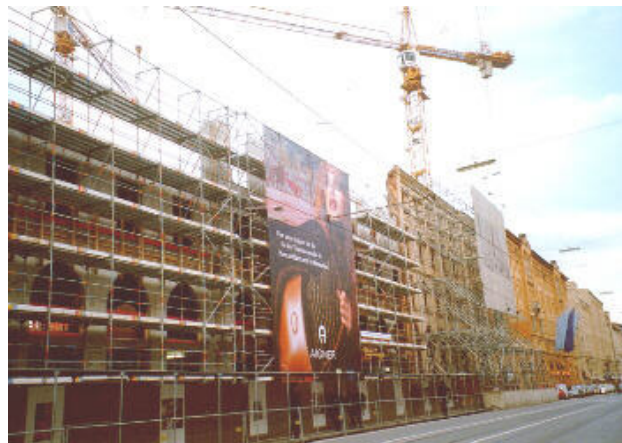
An der Maximilianstraße: Rechts die Bürkleinfassade, links der Neubau

Bereits Ende November 2002 waren die drei Komplexe Bürkleinbau, Maximilianhöfe und Opern-Probengebäude gut zu erkennen. Im Januar 2003 konnte planmäßig das Richtfest gefeiert werden.