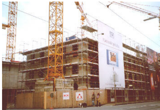
Die Einmündung des Marstallplatzes (Alfons-Goppel-Straße) in die Maximilianstraße im November 2002: Der Neubau in Anlehnung an das historische Vorbild ...