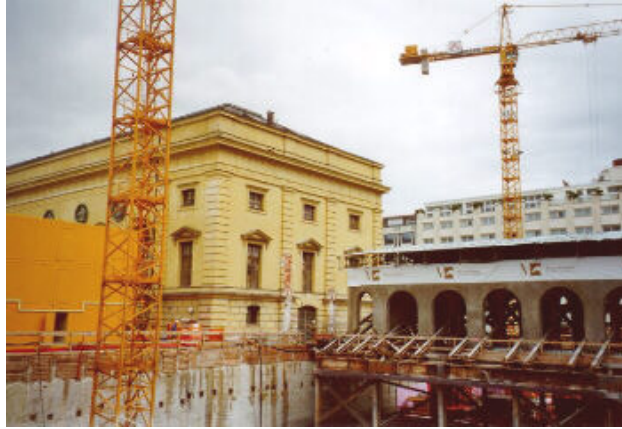
Am Abgrund: Klenzes Marstall und die Hofstallungen, im Juli 2002 umgeben vom Nichts