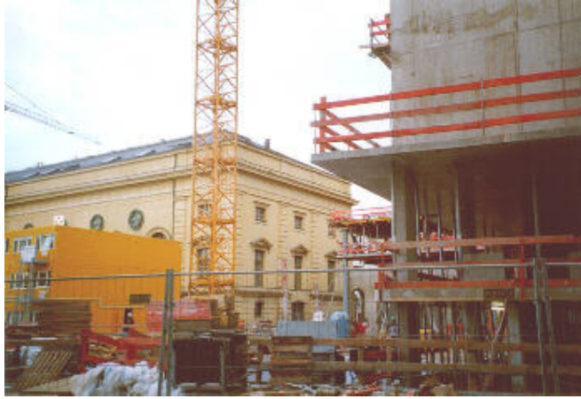
Zwei Versuche, große Baumassen ansprechend zu gliedern: Im Vordergrund das Probengebäude, im Hintergrund der Marstall