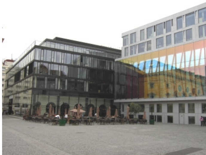
Die neue Nachbarschaft des Marstalls

Auf seiner breiten „Glas-Bauchbinde“ entstand im Sommer 2005 eine interaktive Lichtwand des dänischen Künstler Olafur Eliasson. Auch das Urteil über diese Form von Kunst am Bau ist durchaus geteilt: Manche halten die Fläche, die je nach Blickwinkel ständig changiert, für eine „sensationelle Aufwertung“ des Platzes, während die weitaus größere Zahl der Kritiker von „Show-Effekten“ spricht und Klenzes Marstall „zum Seitenflügel degradiert“ sieht, der dafür herhalten müsse, durch seine Reflexion die „Ödnis der Glasscheiben“ zu beleben.